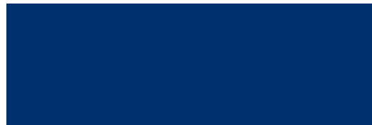
7th GRADE NJSLA LANGUAGE ARTS